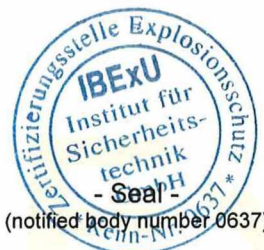
Dr.-Ing. P. Cimalla

Certificates without signature and seal are not valid. Certificates may only be duplicated completely and unchanged. In case of dispute, the German text shall prevail.