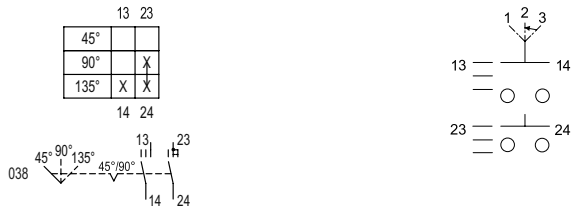
Esquema de conmutación 8008/-038