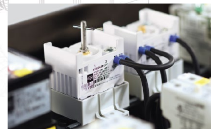
Steuergerät 8208: zur Drahtbruch- und Kurzschlussüberwachung