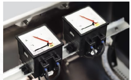
Strom- und Spannungsmesser 8402, 8403, 8404, 8405, 8406 und 8407