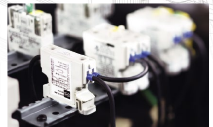
Steuerelement 8453: Widerstände und Dioden