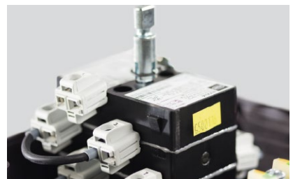
Last- und Motorschalter 8006